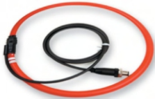
Elastyczne przystawki do pomiaru prądu AC

Wyprodukowany na bazie tej samej innowacyjnej technologii co Analizator Jakości Energii BLACKBOX fixed (PQA), Elspec G4500 BLACKBOX Portable z możliwością ciągłej rejestracji przebiegów jest najbardziej rozbudowanym analizatorem jakości energii na rynku. G4500 BLACKBOX ma możliwości określenia źródła przyczyn wszystkich problemów jakości energii, wystarczy podłączyć urządzenie aby nigdy nie pominąć żadnego zdarzenia. Bezprzewodowy analizator BLACKBOX Portable, wprowadza pojęcie jakości energii (PQ) w wysokiej rozdzielczości, rejestruje i przechowuje wszystkie informacje przez ponad 1 rok czasu z wysoką dokładnością, bez przerw w rejestracji. Z wbudowanym punktem dostępu 802.11b/g oraz routerem Ethernet, BLACKBOX Portable umożliwia zdalną analizę danych z dowolnego miejsca.