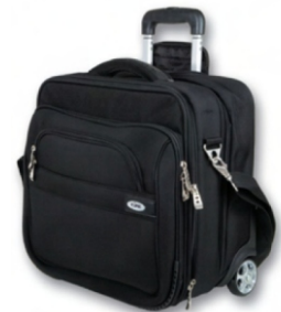
Wytrzymała torba transportowa