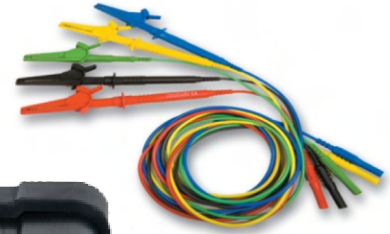
Przewody do pomiaru napięcia AC