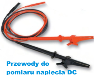
Przewody do pomiaru napięcia DC